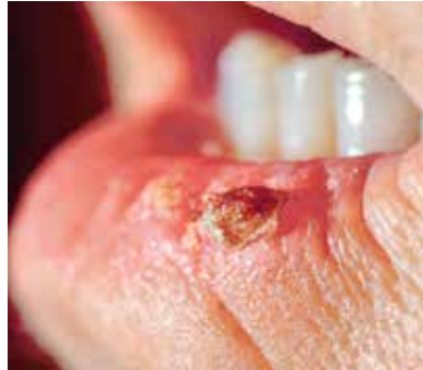
Spinaliom an der Unterlippe

Metastasen können beispielsweise in der Lunge, in der Leber oder im Knochen auftreten.