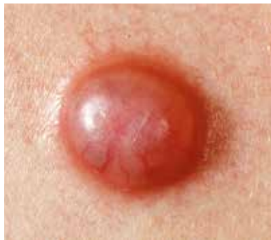
Unterschiedliche Erscheinungsformen von Basaliomen