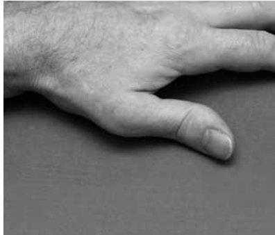
Die Z-Deformität des Daumens, eine typische Fehlstellung