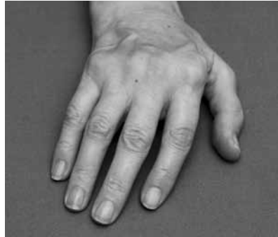
Das Abweichen der Finger nach aussen, eine typische Fehlstellung

gung, ist sie trotz optimaler medikamentöser Behandlung nicht mehr rückgängig zu machen!